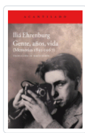
GENTE, AÑOS, VIDA EHRENBURG, ILIA