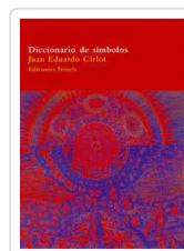
DICCIONARIO DE SIMBOLOS RUSTICA CIRLOT, JUAN EDUARDO