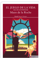
JUEGO DE LA VIUDA, EL DE LA ROCHE, MAZO