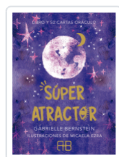
SUPER ATRACTOR BERNSTEIN, GABRIELLE