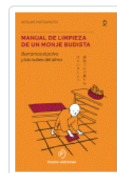
MANUAL DE LIMPIEZA DE UN MONJE BUDISTA MATSUMOTO, KEISUKE