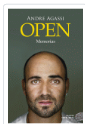
OPEN MEMORIAS ANDRE AGASSI AGASSI, ANDRE