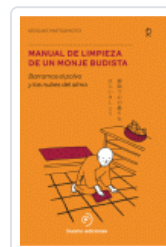
MANUAL DE LIMPIEZA DE UN MONJE BUDISTA MATSUMOTO, KEISUKE