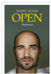
OPEN MEMORIAS ANDRE AGASSI AGASSI, ANDRE