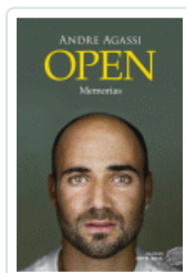
OPEN MEMORIAS ANDRE AGASSI AGASSI, ANDRE