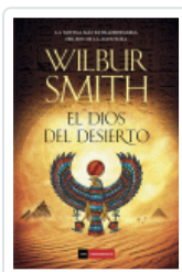
DIOS DEL DESIERTO, EL SMITH, WILBUR