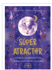
SUPER ATRACTOR BERNSTEIN, GABRIELLE