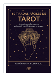
60 TIRADAS FÁCILES DE TAROT PLANA LOPEZ, RAMON / ROIG RIBAS, OLGA