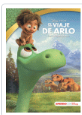
VIAJE DE ARLO (LEO, JUEGO Y APRENDO) DISNEY