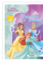
PRINCESAS DISNEY. COMO UNA PRINCESA (LEO CON DISNEY NIVEL 2) DISNEY