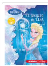
FROZEN. EL SECRETO DE ELSA (LEO CON DISNEY NIVEL 2) DISNEY