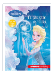
FROZEN. EL SECRETO DE ELSA (LEO CON DISNEY NIVEL 2) DISNEY