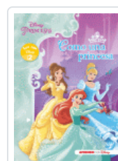
PRINCESAS DISNEY. COMO UNA PRINCESA (LEO CON DISNEY NIVEL 2) DISNEY