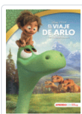
VIAJE DE ARLO (LEO, JUEGO Y APRENDO) DISNEY