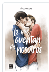
LO QUE CUENTAN DE NOSOTROS AGUAS, INIGO