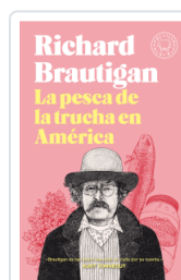
PESCA DE LA TRUCHA EN AMERICA, LA BRAUTIGAN, RICHARD