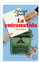
ENTROMETIDA, LA SPARK, MURIEL