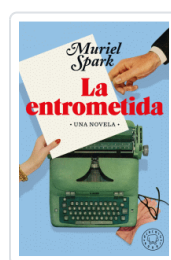
ENTROMETIDA, LA SPARK, MURIEL