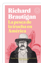
PESCA DE LA TRUCHA EN AMERICA, LA BRAUTIGAN, RICHARD