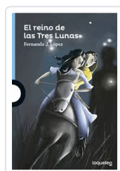
REINO DE LAS TRES LUNAS, EL LOPEZ, FERNANDO J.