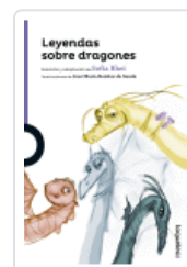
LEYENDAS SOBRE DRAGONES RHEI, SOFIA