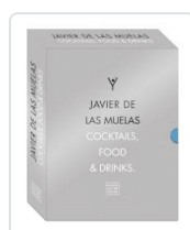
COCKTAILS, DRINKS & FOOD MUELAS, JAVIER DE LAS