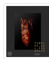
TEMPLOS DEL PRODUCTO BENEYTO, BORJA / MATEOS, CARLOS