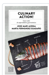
CULINARY ACTION! BASQUE CULINARY CENTER