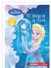
FROZEN. EL SECRETO DE ELSA (LEO CON DISNEY NIVEL 2) DISNEY