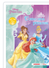
PRINCESAS DISNEY. COMO UNA PRINCESA (LEO CON DISNEY NIVEL 2) DISNEY