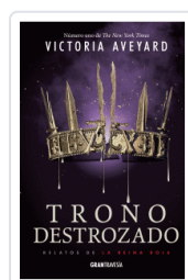
TRONO DESTROZADO AVEYARD, VICTORIA