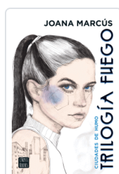
TRILOGIA FUEGO 1. CIUDADES DE HUMO MARCUS, JOANA