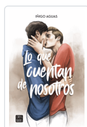
LO QUE CUENTAN DE NOSOTROS AGUAS, INIGO