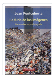
FURIA DE LAS IMAGENES, LA FONTCUBERTA, JOAN