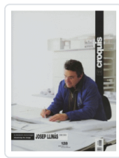
EL CROQUIS 128: JOSEP LLINAS VV.AA.