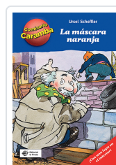
MASCARA NARANJA, LA (COMISARIO CARAMBA 2) SCHEFFLER, URSEL