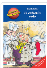
CALCETIN ROJO, EL (COMISARIO CARAMBA 1) SCHEFFLER, URSEL