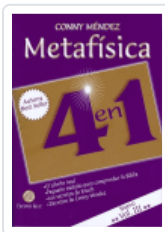
METAFISICA 4 EN 1. VOL III N/E MENDEL, CONNY