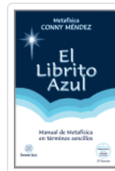
LIBRITO AZUL, EL MENDEZ, CONNY