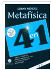
METAFISICA 4 EN 1. VOL II N/E MENDEL, CONNY