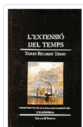
EXTENSIO DEL TEMPS (E.43) RICARDO, X.