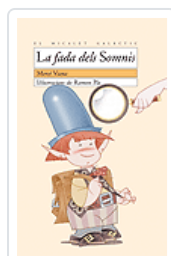
FADA DELS SOMNIS (MG.91) VIANA, MERCE