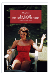
CLUB DE LOS MENTIROsos, EL KARR, MARY