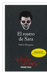
ROSTRO DE SARA, EL (LADO OSCURO) BURGUSS, MELVIN