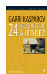
24 LECCIONES DE AJEDREZ KASPAROV, GARI