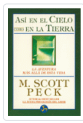
ASI EN EL CIELO COMO EN LA TIERRA PECK