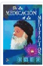
DE LA MEDICACION A LA MEDITACION OSHO