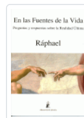
EN LAS FUENTES DE LA VIDA RAPHAEL