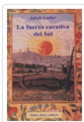
FUERZA CURATIVA DEL SOL LORBER, JAKOB / MUNOZ MOYA, MIGUEL ANGEL