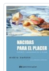
NACIDAS PARA EL PLACER (DELICATESSEN) DARDER, MIREIA