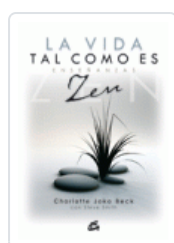
VIDA TAL COMO ES, LA