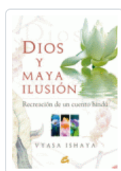
DIOS Y MAYA ILUSION