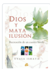
DIOS Y MAYA ILUSION