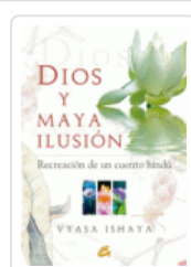
DIOS Y MAYA ILUSION