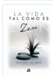
VIDA TAL COMO ES, LA