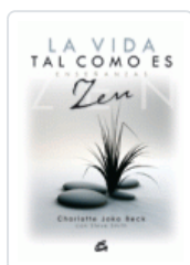
VIDA TAL COMO ES, LA