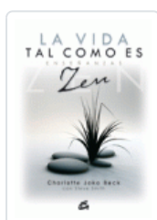
VIDA TAL COMO ES, LA