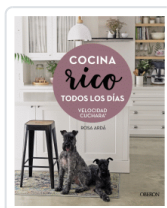
COCINA RICO TODOS LOS DIAS (VELOCIDAD CUCHARA) ARDA, ROSA