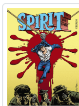
SPIRIT, THE EISNER, WILL