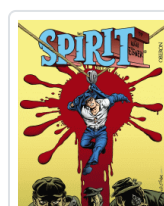
SPIRIT, THE EISNER, WILL