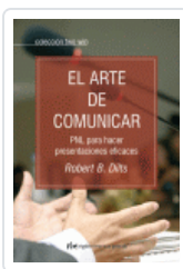
ARTE DE COMUNICAR DILTS, ROBERT B.