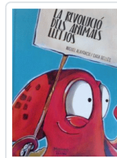
REVOLUCIO DELS ANIMALS LLETJOS, LA ALAYRACH, MIGUEL