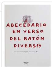
ABECEDARIO EN VERSO DEL RATÓN DIVERSO SALINAS GRAS, PAULA