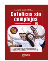
MANUAL BASICO PARA CATOLICOS SIN COMPLEJOS GONZALEZ HORRILLO, JOSE