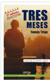
TRES MESES (N.E.) TRIGO OUBIÑA, TOMAS