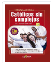
MANUAL BASICO PARA CATOLICOS SIN COMPLEJOS GONZALEZ HORRILLO, JOSE