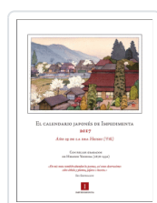
CALENDARIO JAPONES 2017 DE IMPEDIMENTA VV.AA.