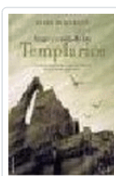
AUGE Y CAIDA DE LOS TEMPLARIOS DEMURGER, ALAIN