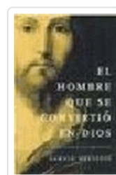
HOMBRE QUE SE CONVIRTIÓ EN DIOS, EL MESSADIE, G.