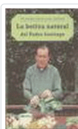
BOTICA NATURAL DEL PADRE SANTIAGO, LA