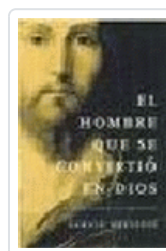
HOMBRE QUE SE CONVERTIO EN DIOS, EL MESSADIE, G.