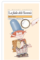
FADA DELS SOMNIS (MG.91) VIANA, MERCE