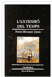
EXTENSIO DEL TEMPS (E.43) RICARDO, X.