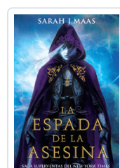
ESPADA DE LA ASESINA LA MAAS, SARAH J.