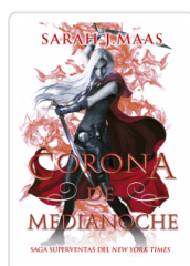
CORONA DE MEDIANOCHE II (TRONO DE CRISTAL 2) MAAS, SARAH J.