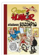
SUPER HUMOR EL BOTONES SACARINO IBAÑEZ, FRANCISCO