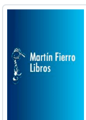
SUPER HUMOR MORTADELO Nº 60 IBAÑEZ, FRANCISCO