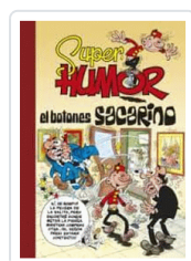
SUPER HUMOR EL BOTONES SACARINO IBÁÑEZ, FRANCISCO