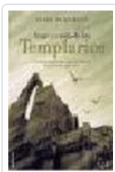
AUGE Y CAÍDA DE LOS TEMPLARIOS DEMURGER, ALAIN