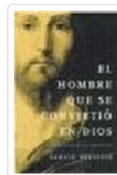
HOMBRE QUE SE CONVIRTIÓ EN DIOS, EL MESSADIE, G.