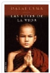
LEYES DE LA VIDA, LAS LEYES DE LA VIDA DALAI LAMA