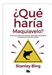
QUE HARIA MAQUIAVELO? BING, STANLEY