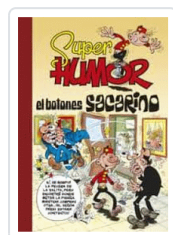
SUPER HUMOR EL BOTONES SACARINO IBÁÑEZ, FRANCISCO